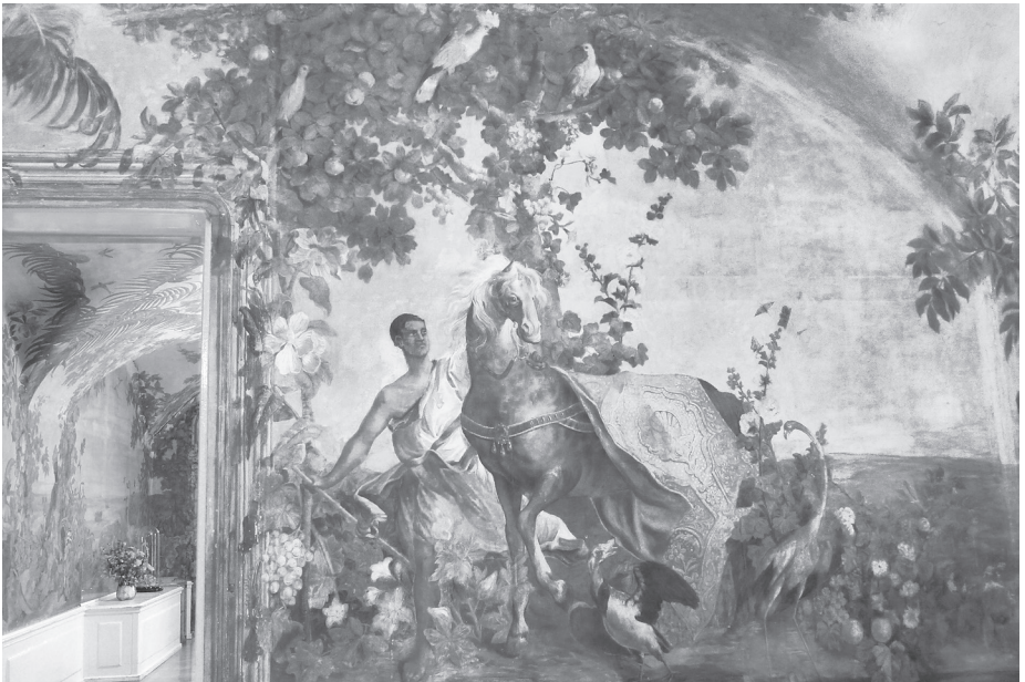
Fresken des Malers Johann Bergl (1718–1789) in einem ebenerdigen Zimmer im östlichen Trakt des Schlosses Ober-St.-Veit